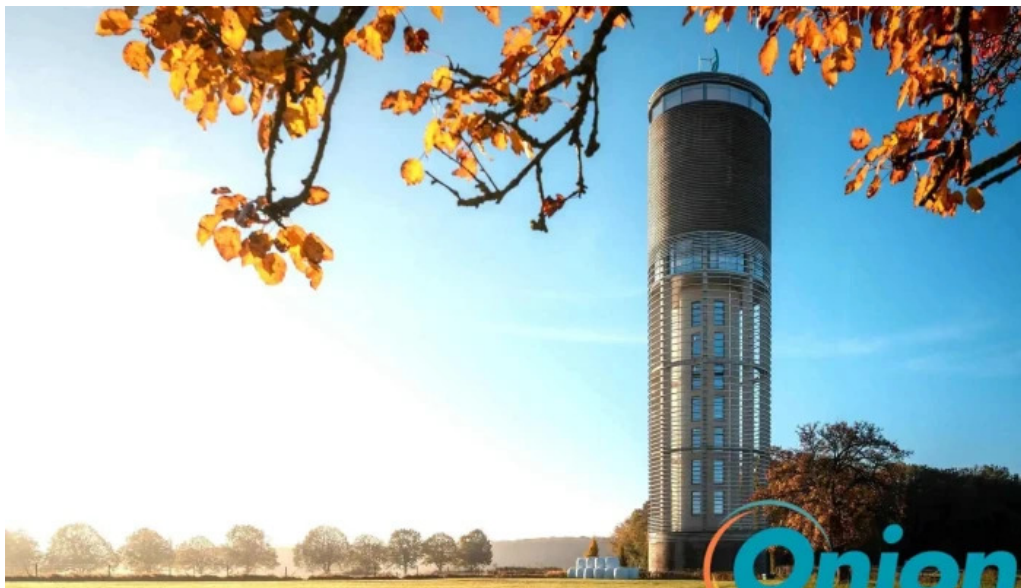
Wasserturm berdorf vom inhaber