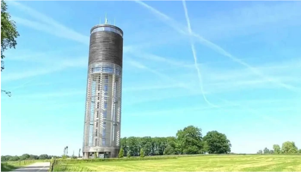
Wasserturm berdorf videos