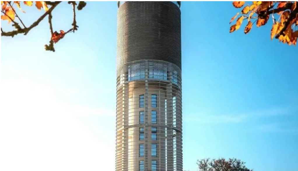
Wasserturm berdorf remisene