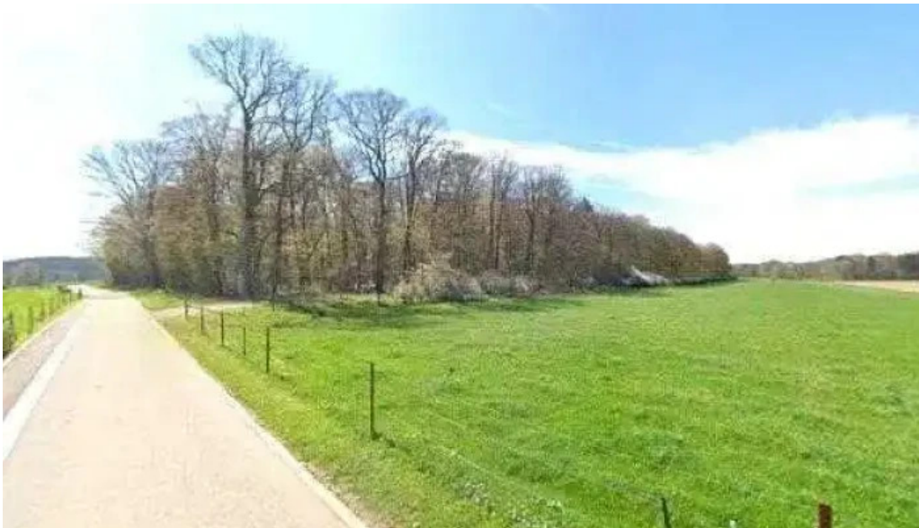
Wasserturm berdorf street view 360deg fotos