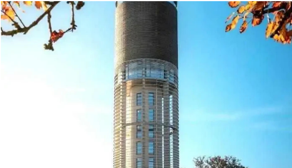
Wasserturm berdorf berdorf