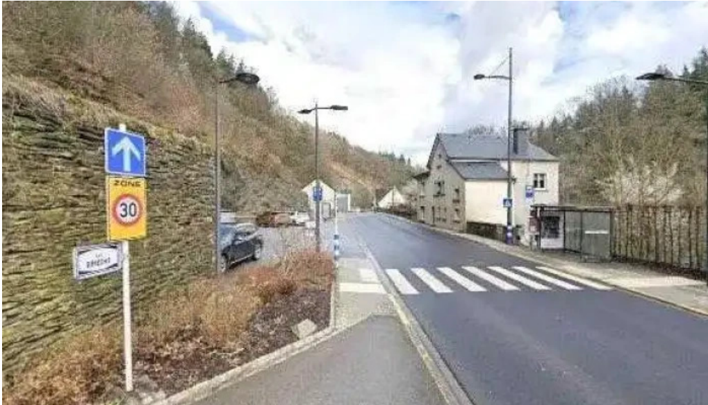
Croix rouge buttek epicerie sociale clervaux street view 360deg fotos