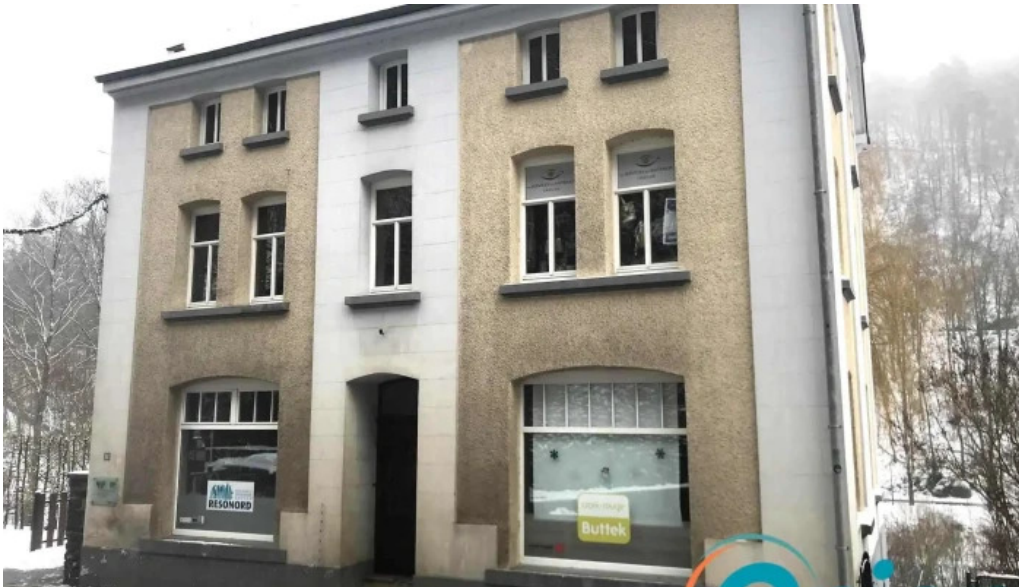
Croix rouge buttek epicerie sociale clervaux geigende