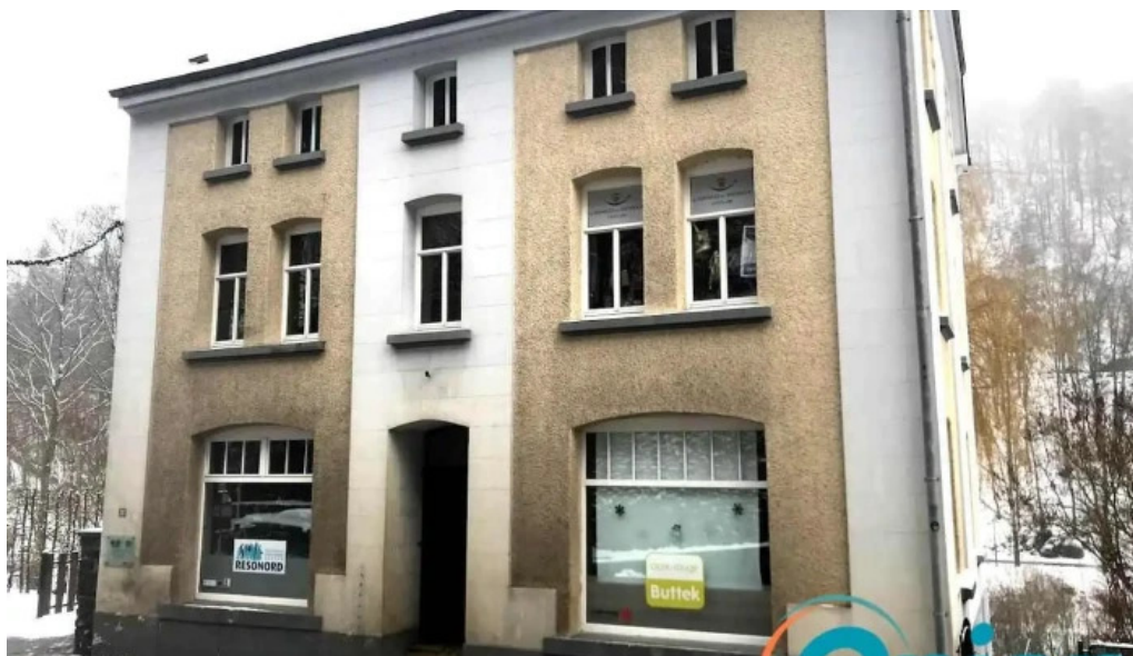
Croix rouge buttek epicerie sociale clervaux clerv