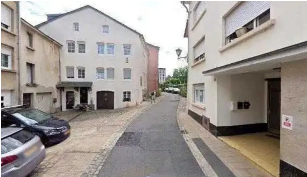
Rotes kreuz laden tafel remich videoene