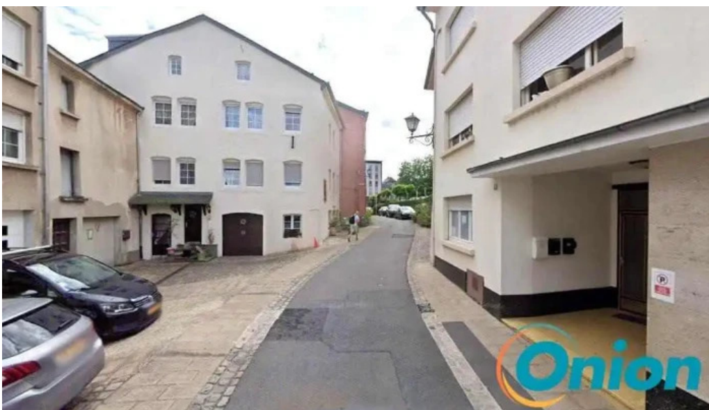
Rotes kreuz laden tafel remich remich