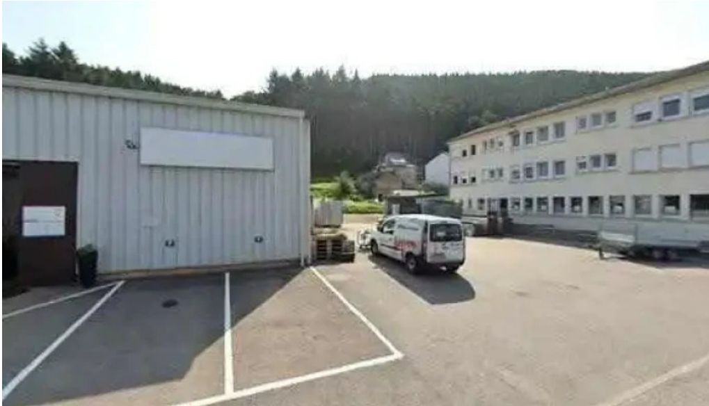
Rotes kreuz sozialladen wiltz street view 360deg fotos