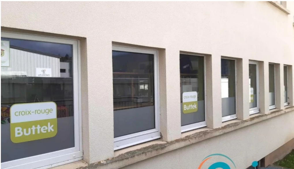
Rotes kreuz sozialladen wiltz elo ope