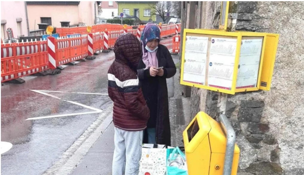
Rotes kreuz sozialladen wiltz wiltz