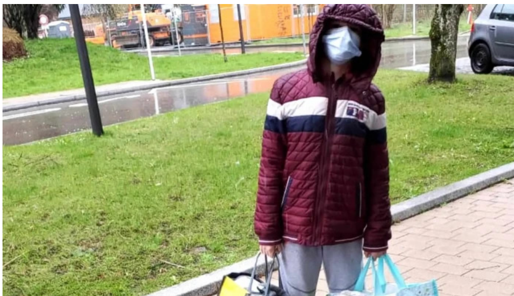
Rotes kreuz sozialladen wiltz elo op