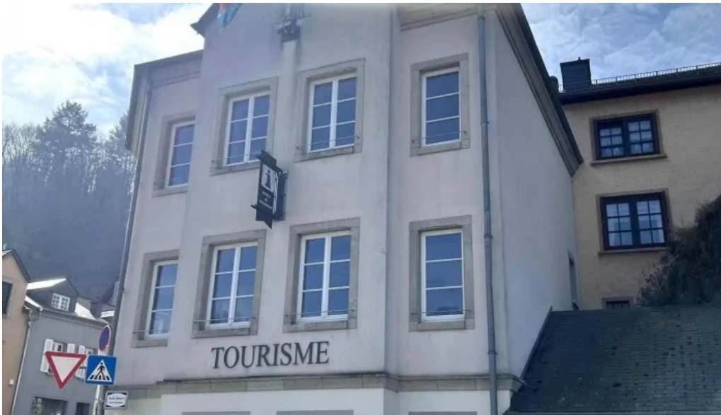
Tourist information vianden neueste