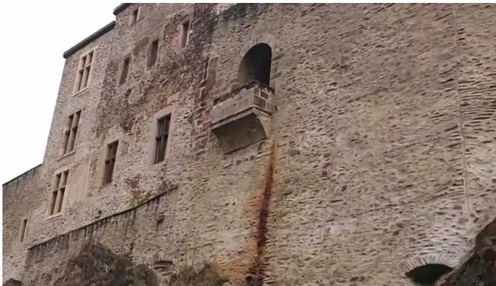
Tourist information vianden videos