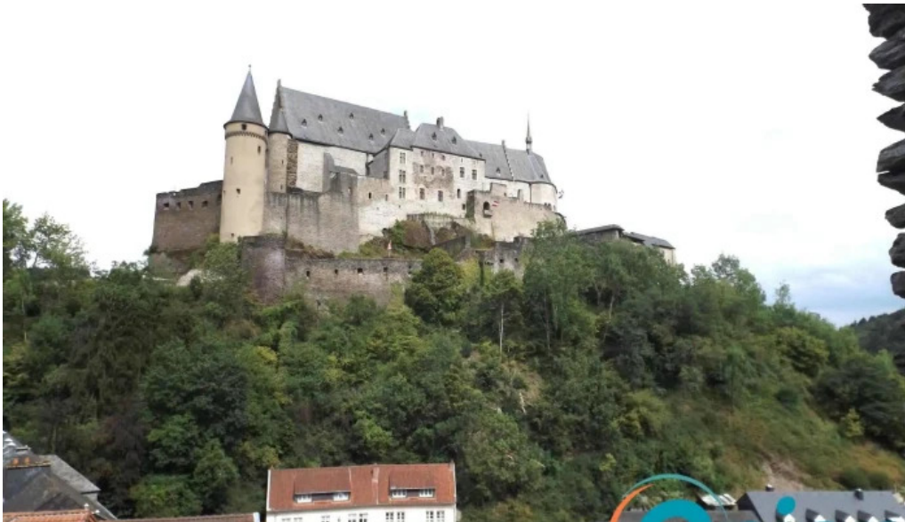
Tourist information vianden aussenbereich