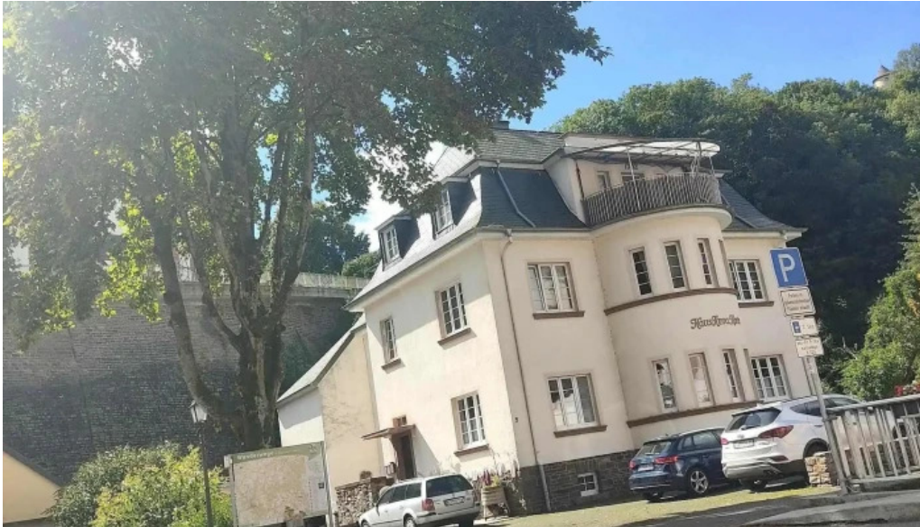
Tourist information vianden no bei mir