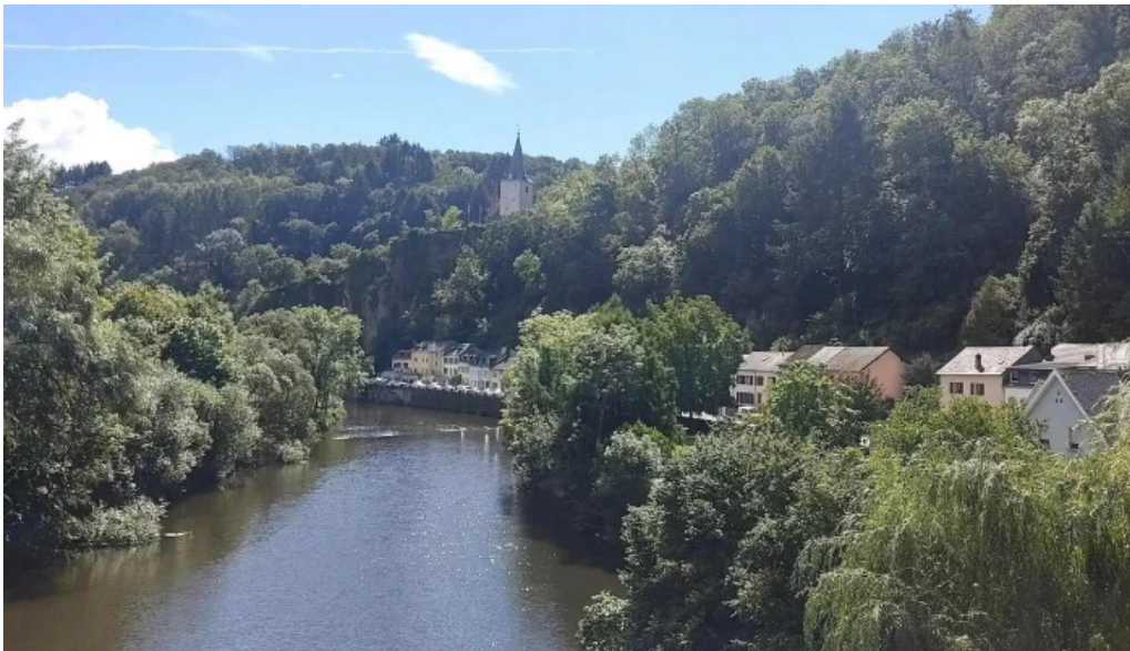
Tourist information vianden fotoen