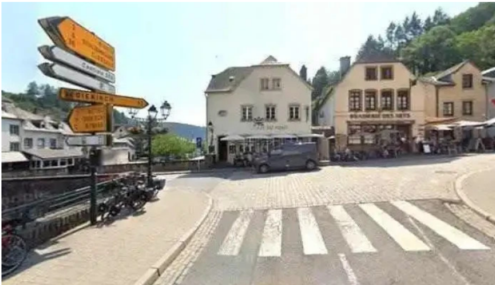
Tourist information vianden street view 360deg fotos