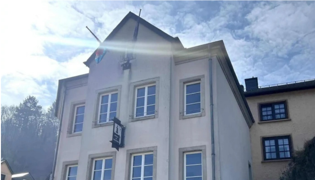
Tourist information vianden vianden