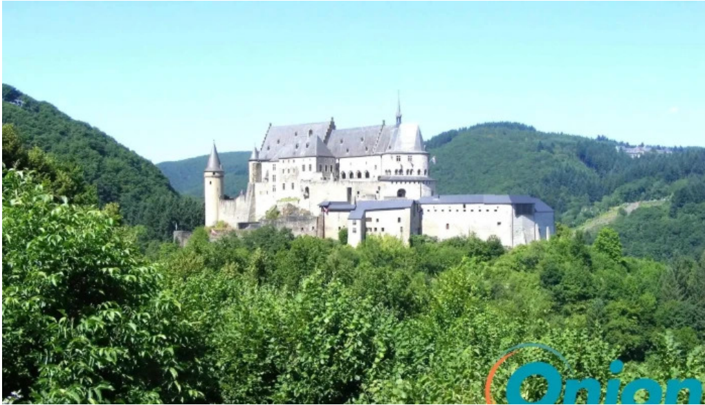
Tourist information vianden fotoene