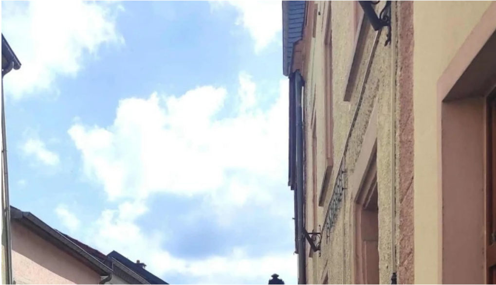
Tourist information vianden instagram