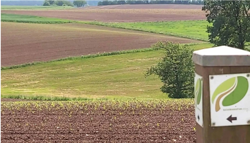
Natour route 6 no bei mir