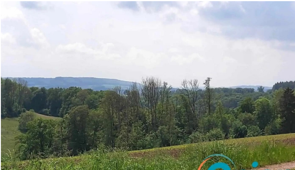
Natour route 6 no bei mire