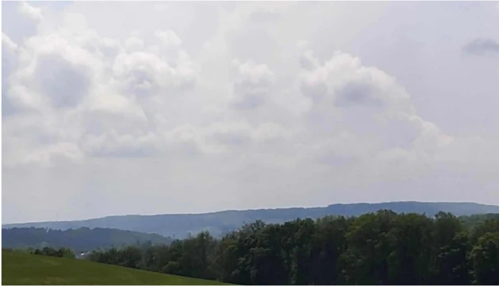
Natour route 6 praisser