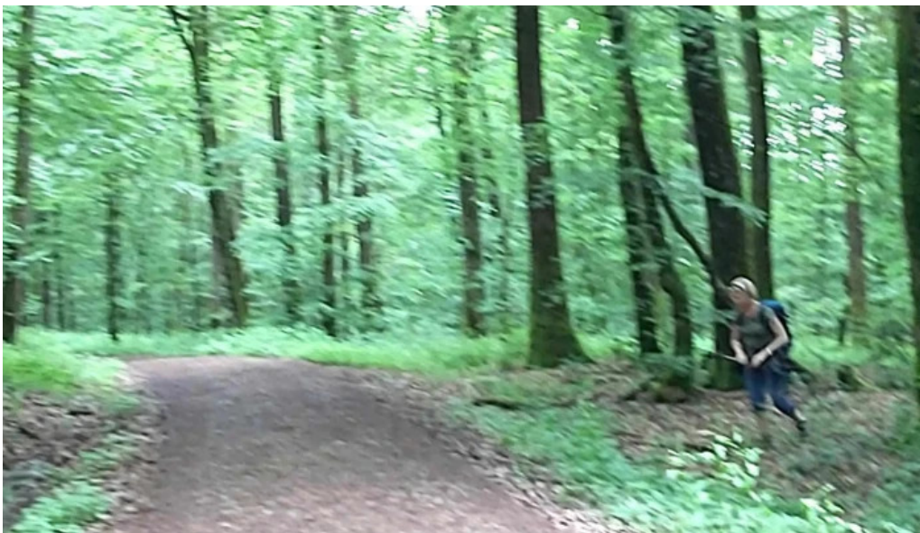
Natour route 6 vianden