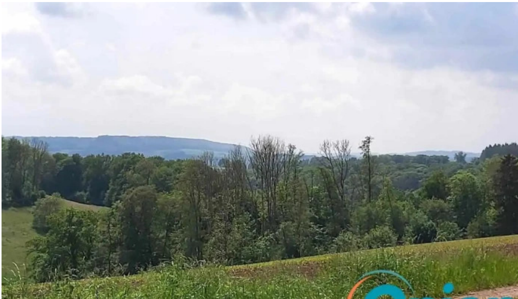
Nat our route 6 vianden