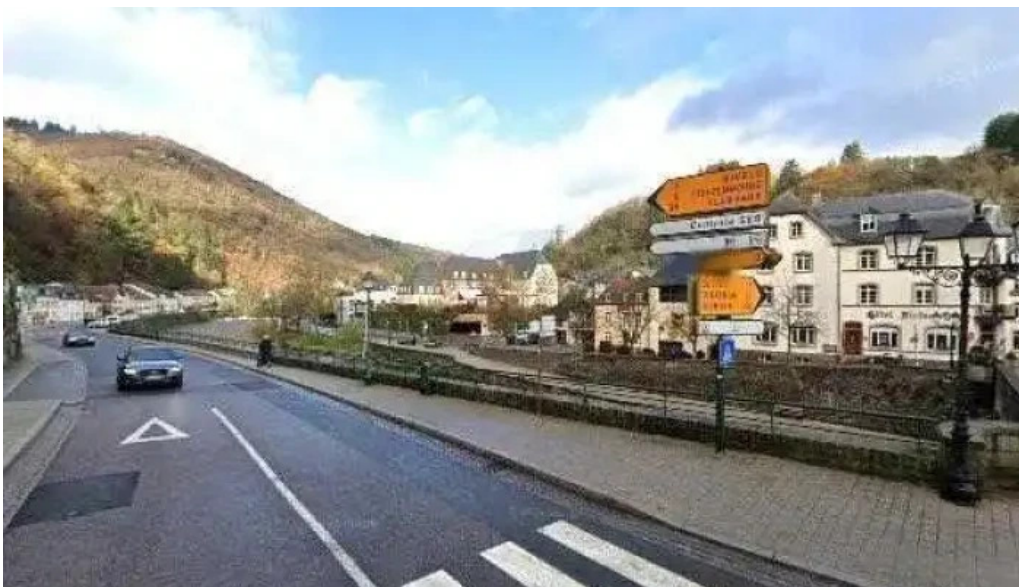
Natour route 6 street view 360deg fotos