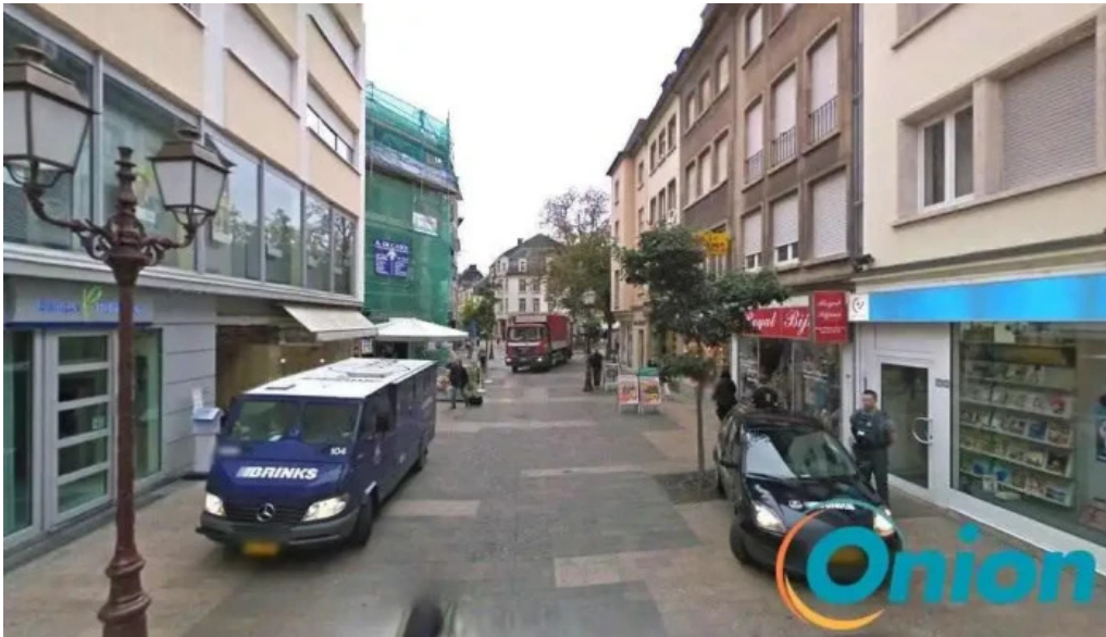
K kiosk lies buttek ettelbruck