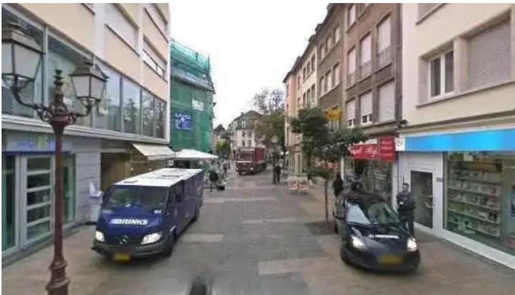
K kiosk lies buttek telefone